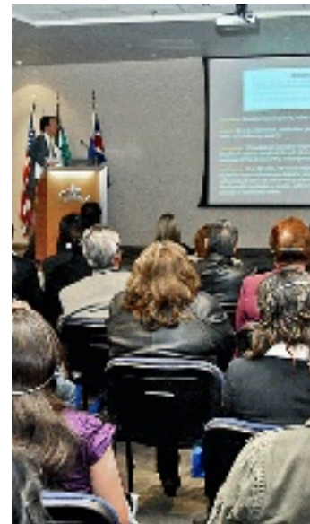
Revelaron datos de últimas investigaciones.